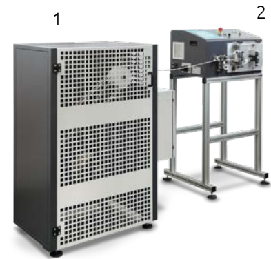
Esempio di montaggio in linea: 1 Svolgitore motorizzato 2 Macchina taglia spela sguaina